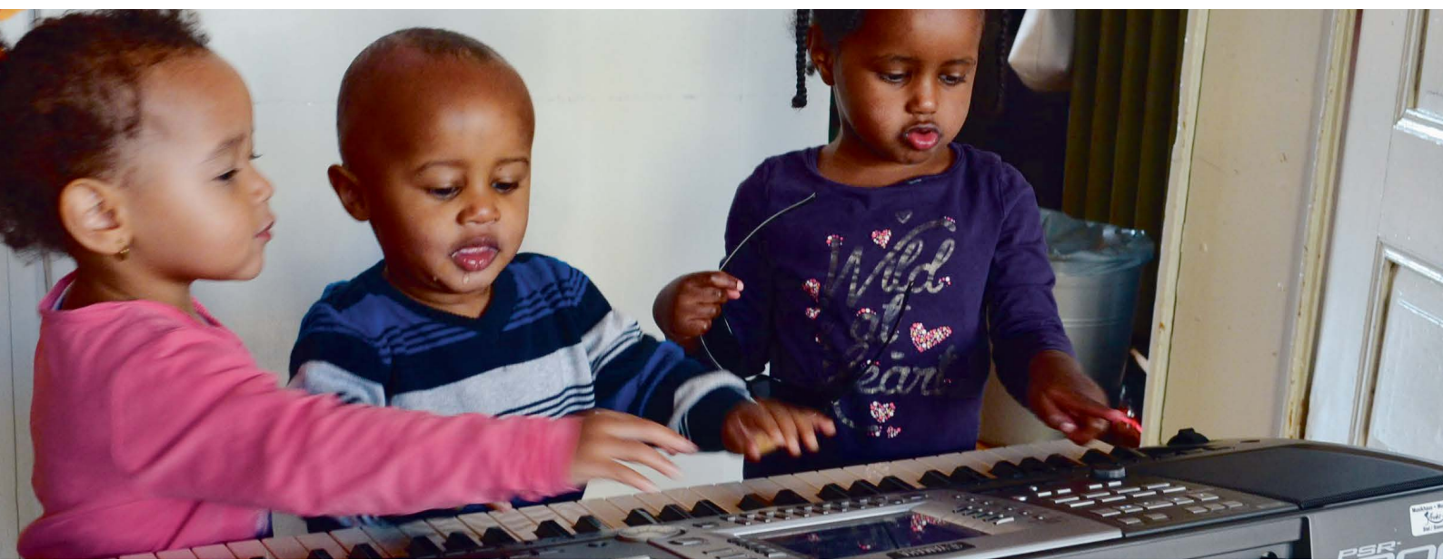
Impression du projet « Musikalische Früherziehung und Sprachförderung » de l'école de musique de Bienne et de l'Université populaire Bienne-Lyss.

Le sous-projet « Gestion du savoir – apprendre à l'école de musique » vise à préparer la création d'une base de données en ligne sur des approches novatrices des écoles de musique. L'objectif