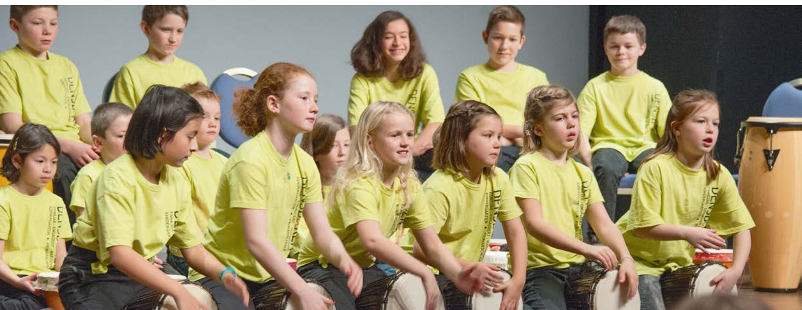
Spectacle rythmique de l'école de musique de Densbüren lors du Forum sur la formation musicale 2016.

Des lignes directrices articulées autour des trois principes repérer – encourager – mettre en réseau, un aperçu des offres d'encouragement et de leurs contenus ainsi qu'une présentation des structures d'encouragement résument en quelques pages les aspects essentiels de cette thématique. Les lignes directrices sont destinées à servir de base pour la mise en œuvre de l'article constitutionnel 67a dans le domaine de l'encouragement des talents. Il a été adopté par les associations cantonales lors de l'assemblée des délégués de mars 2017 et présenté à un groupe de parlementaires fédéraux, de représentants de l'Office fédéral de la culture et des associations nationales de musique dans le cadre du Groupe parlementaire Musique.