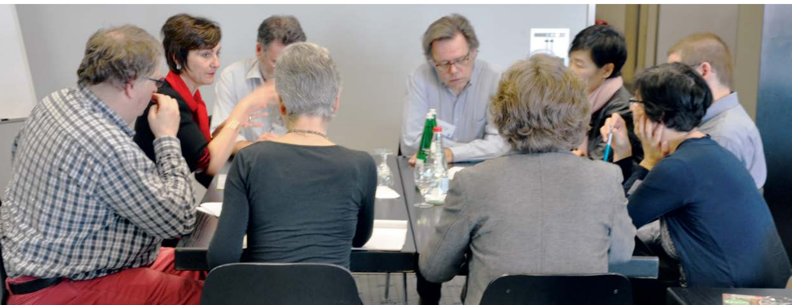
Atelier « Stratégie nationale d'encouragement des talents musicaux en Suisse » lors de l'assemblée des délégués de l'ASEM du 17 mars 2017.