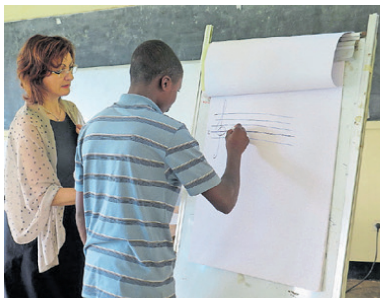
Aneignung der musikalischen Grundbegriffe.