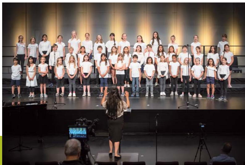
Singschule der Musikschule Zug im Live-Stream – Petit chœur de l'école de musique de Zoug en live-stream