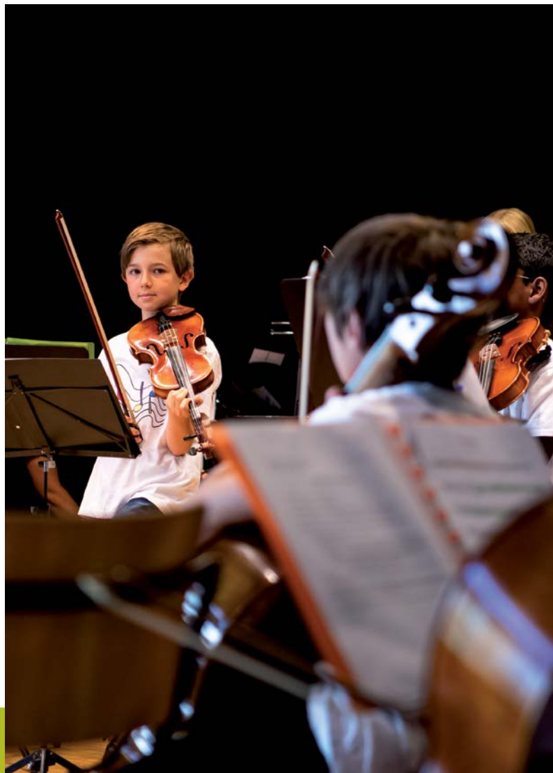
Petite bande des Konservatoriums Freiburg – Petite bande du Conservatoire de Fribourg