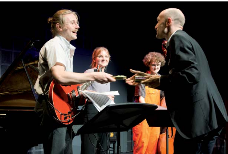
Pre-College-Student*innen der HLSU-Musik – Etudiant-es de la filière préprofessionnelle de la HSLU-Musique

Le Message culture 2021–2024, adopté par le Parlement fédéral en automne 2020, prévoit la création d'une carte talent destinée à soutenir les jeunes talents musicaux dans le cadre de la mise en œuvre du mandat constitutionnel de l'art. 67a, al. 3, Cst. Début 2021, l'Office fédéral de la culture OFC a constitué un groupe de travail chargé d'élaborer une stratégie générale. Placé sous la direction de l'OFC, ce groupe réunit la Conférence des directeurs cantonaux de l'instruction publique, l'Association des communes et l'Union des villes suisses, le Conseil suisse de la musique, la Conférence des hautes écoles de musique