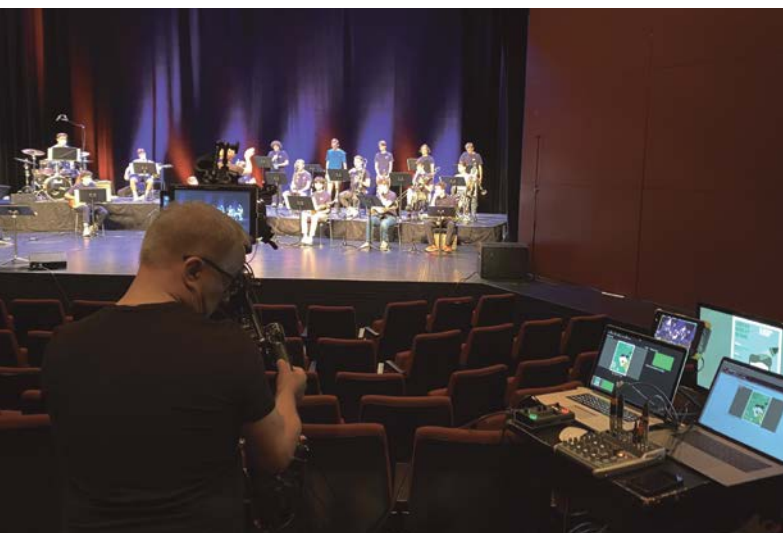
Big Band der Musikschule Zug im Live-Stream – Big band de l'école de musique de Zoug en live-stream

Les connaissances acquises à travers cette étude offrent une bonne base pour réagir aux conséquences de la pandémie sur l'accès à la formation musicale et contribuer ainsi au maintien de l'égalité des chances, et pourront d'autre part être intégrées avec profit dans le développement continu de l'offre des écoles de musique.