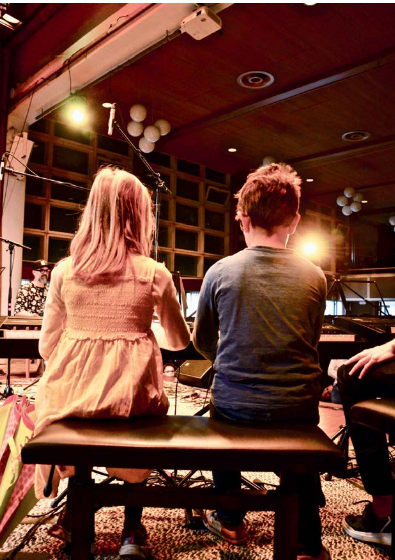
Impression vom Bandmonat der Musikschule Wohlen – Impression du mois des bands de l'école de musique de Wohlen

Le groupe a ensuite élaboré jusqu'à la fin de l'année une ébauche du document avec le comité et le groupe de travail.