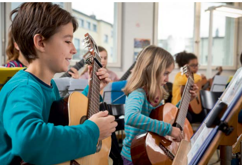
Gitarrenensemble der Musikschule Biel – Ensemble de guitare de l'École de Musique Bienne

En outre, grâce à sa coopération avec l'Association des communes suisses, l'ASEM s'est vue offrir la possibilité de présenter le projet et de joindre la carte d'information dans le numéro 4/2021 de la publication Commune Suisse .