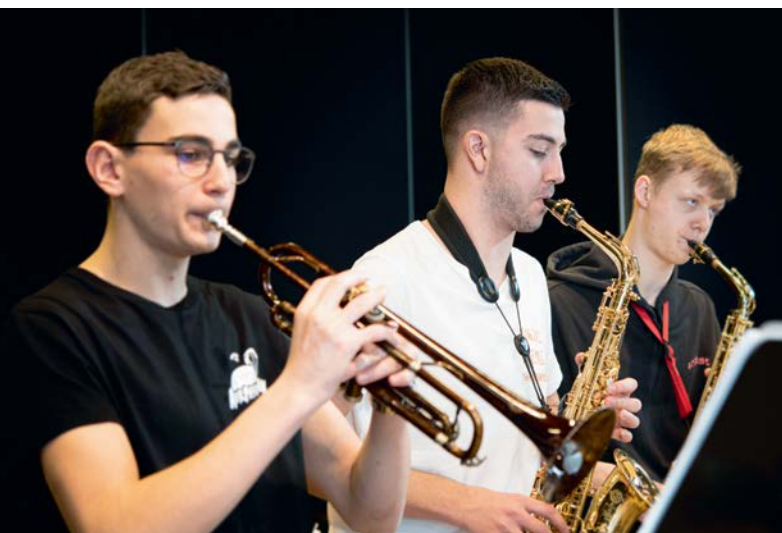
Bläser des Young Jazz Ensemble Konservatoriums Freiburg – Les vents du Young Jazz Ensemble du Conservatoire de Fribourg

La gamme des services proposés par l' ASEM à ses membres est complétée par la prévoyance professionnelle avec la Caisse de pension Musique et Formation de l'association, ainsi que par l'assurance maladie Sanitas . Dans le secteur de la promotion de la santé à l'école de musique, l' ASEM et la Caisse de pension Musique et Formation collaborent depuis des années avec active care ag en tant que partenaire opérationnel. C'est ainsi que durant l'année sous revue, 121 écoles de musique ont utilisé les services de promotion de la santé dans le domaine de la prévention, de la gestion des absences et de la gestion de cas.