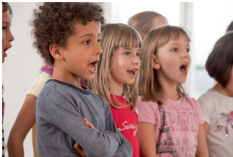
Kinderchor der Musikschule Biel – Chœur des enfants de l'École de Musique Bienne