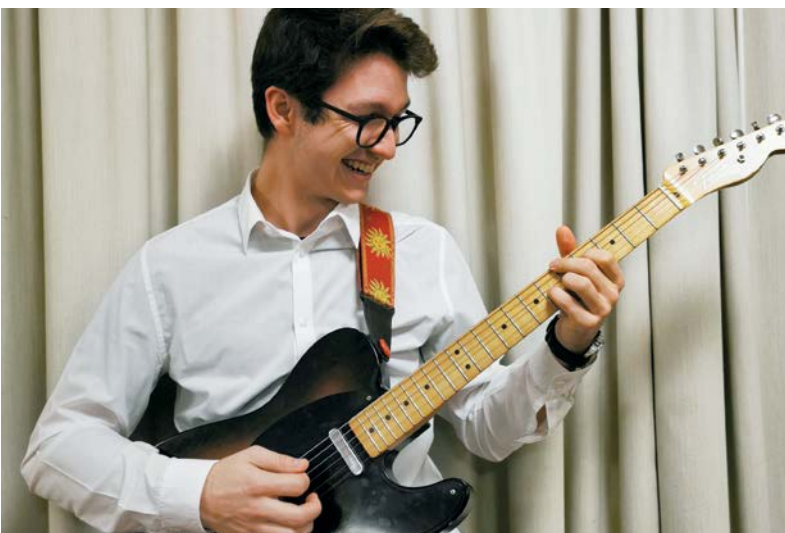
E-Gitarrenschüler der Kreismusikschule Pratteln, Augst und Giebenach – Elève de guitare électrique de l'école de musique de Pratteln, Augst et Giebenach

Un rapport d'études détaillé et une version résumée ont été élaborés durant l'année sous revue, et publiés au printemps 2022.