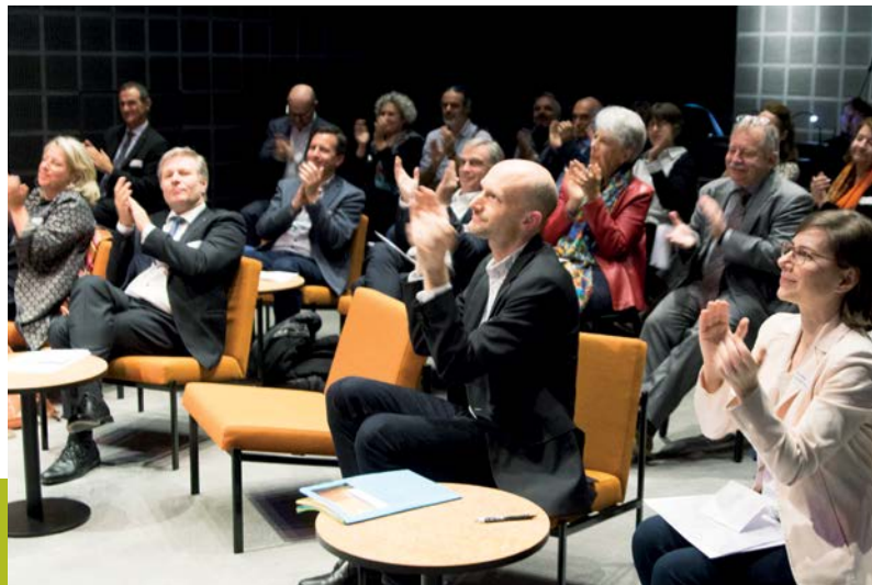
Zertifikatsfeier Label Pre-College Music CH – Cérémonie de remise des certificats label Pre-College Music CH

Le 29 octobre 2021, dans le cadre d'une cérémonie organisée à la Haute école spécialisée de Lucerne – Musique, le label Pre-College Music CH , développé par l'Association suisse des écoles de musique ASEM et la Conférence des hautes écoles de musique suisses CHEMS, a été attribué pour la première fois à sept institutions nationales d'encouragement des talents des trois régions linguistiques. Les écoles et hautes écoles de musique ayant obtenu ce label disposent de filières préprofessionnelles spécifiquement destinées aux jeunes talents présentant un potentiel de formation en haute école, et remplissent des critères exigeants fixés dans un règlement. Le label de l'ASEM et de la CHEMS est indépendant des disciplines musicales et se base sur les normes internationales pour les filières préprofessionnelles (« pre-college ») établies par les trois associations faïtières européennes Association Européenne des Conservatoires, Académies de Musique et Musikhochschulen AEC, European Association for Music in Schools EAS et European Music School Union EMU . Il définit des critères portant sur les parties prenantes, le contenu de la formation, le contexte des coopérations, les contrôles de la qualité et le financement.