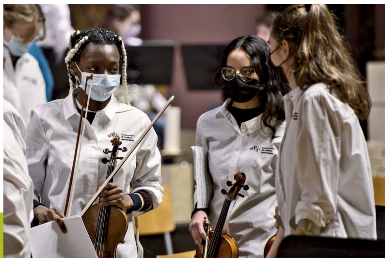
Ensemble des Conservatoire de musique neuchâtelois – Ensemble du Conservatoire de musique neuchâtelois