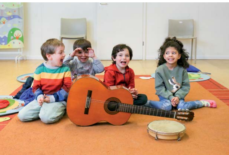
Educazione musicale elementare, Scuola di Musica, Conservatorio della Svizzera italiana, Lugano