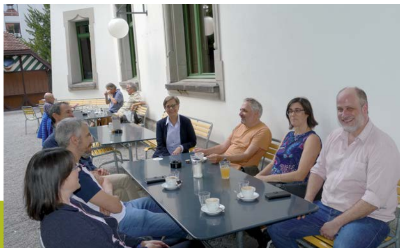
Klausurtag des VMS-Vorstands – Réunion stratégique du comité de l'ASEM