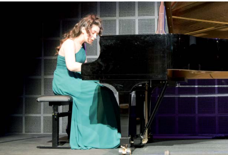
Pre-College-Studentin des Conservatorio della Svizzera italiana, Lugano – Etudiante en filière préprofessionnelle du Conservatorio della Svizzera italiana, Lugano

Das vom Verband Musikschulen Schweiz VMS und der Konferenz Musikhochschulen Schweiz KMHS entwickelte Label Pre-College Music CH wurde am 29. Oktober 2021 anlässlich der Zertifikatsfeier an der Hochschule Luzern – Musik erstmals an sieben national anerkannte Institutionen* der musikalischen Begabtenförderung aus drei Sprachregionen verliehen. Die mit dem Qualitätslabel zertifizierten Musikhochschulen und Musikschulen verfügen über spezifische Pre-College Lehrgänge für begabte Jugendliche mit Hochschulpotential, und sie erfüllen die in einem Reglement festgelegten, anspruchsvollen Kriterien. Das spartenunabhängige Label des VMS und der KMHS orientiert sich an den internationalen Standards für Pre-Colleges der drei europäischen Dachverbände Association Européenne des Conservatoires, Académies de Musique et Musikhochschulen AEC, European Association for Music in Schools EAS und der European Music School Union EMU . Es definiert Kriterien zur Anspruchsgruppe, zum Lehrinhalt, zum Umfeld der Kooperationen, zur Qualitätskontrolle und zur Finanzierung.