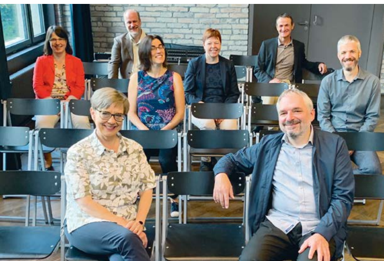
VMS-Vorstand und Team der Geschäftsstelle – Le comité de l'ASEM et l'équipe du secrétariat: