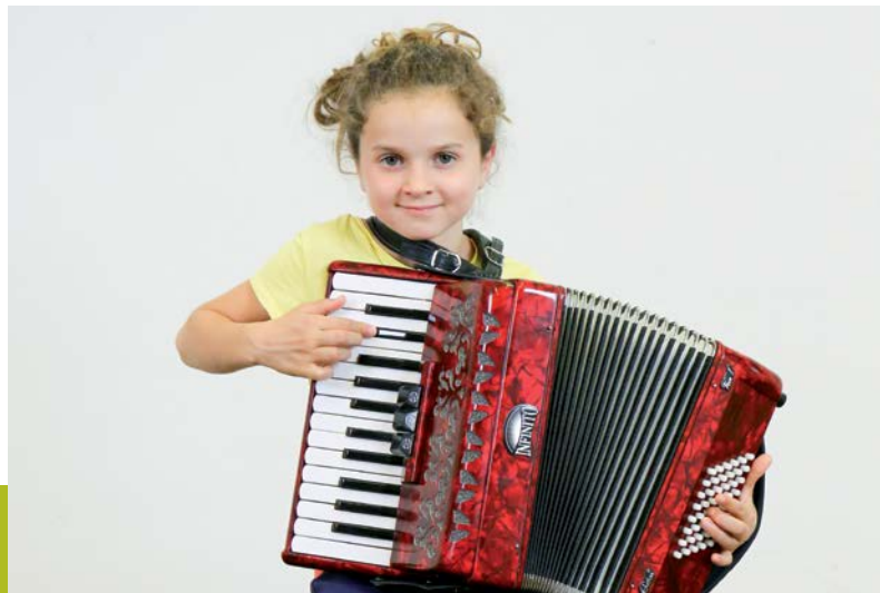
Akkordeonschülerin der Scuola di musica, Conservatorio della Svizzera italiana, Lugano – Elève accordéoniste de la Scuola di musica, Conservatorio della Svizzera italiana, Lugano