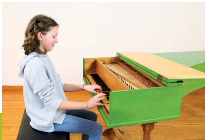
Cembaloschülerin der Scuola di Musica, Conservatorio della Svizzera italiana, Lugano – Elève de clavecin de la Scuola di Musica, Conservatorio della Svizzera italiana, Lugano

Les écoles de musique quarte open label se réunissent à intervalles réguliers pour un échange d'expérience. La prochaine rencontre aura lieu au printemps 2022. Ces réunions offrent l'occasion de recevoir des conseils utiles et d'échanger les idées.