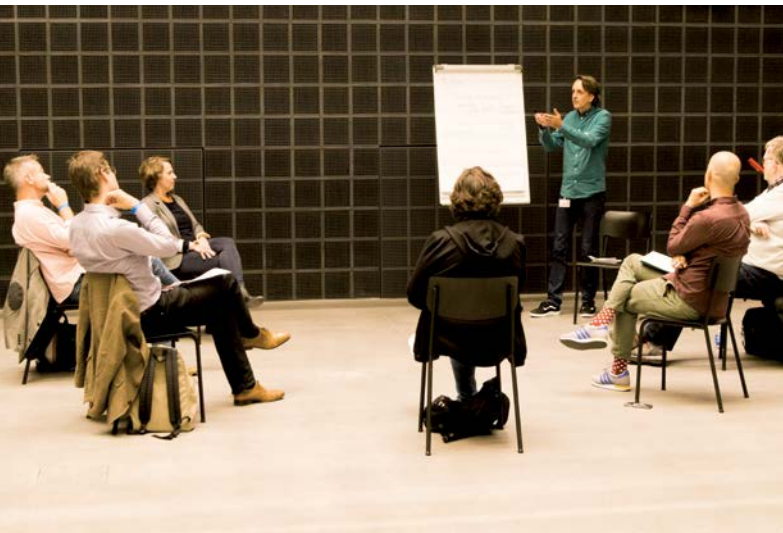
Workshop an der Regionalkonferenz Zentralschweiz in Luzern – Atelier lors de la conférence régionale de Suisse centrale à Lucerne