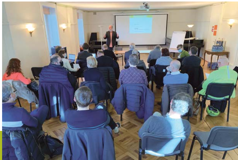
Conférence romande in Lausanne – Conférence romande à Lausanne