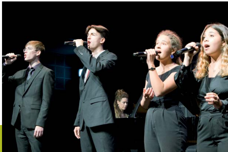
Pre-College-Gesangsquartett des Conservatoire de musique neuchâtelois – Quatuor vocal de la filière préprofessionnelle du Conservatoire de musique neuchâtelois